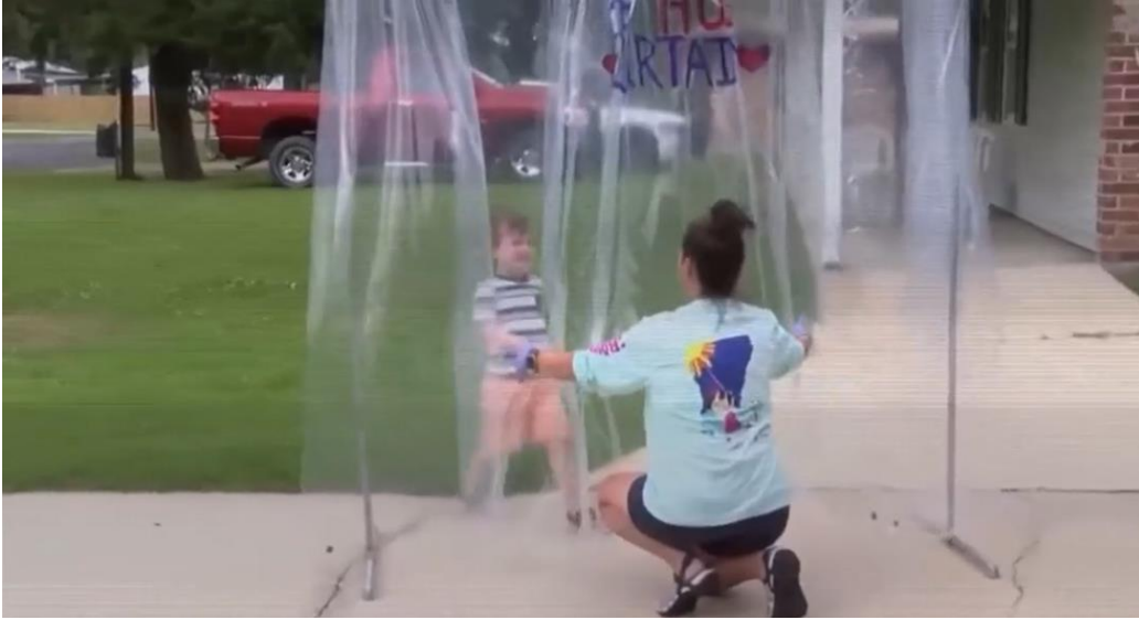
Cortina de los abrazos

Requisitos para recibir fondos, que los distritos escolares finalmente cumplieron: ♦ Uso universal y correcto de máscaras; ♦ modificar las instalaciones para permitir el distanciamiento físico; ♦ lavado de manos y etiqueta respiratoria; ♦ limpieza y mantenimiento de instalaciones saludables, incluida la mejora de la ventilación; ♦ rastreo de contactos en combinación con aislamiento y cuarentena, en colaboración con los departamentos de salud estatales, locales, territoriales o tribales; ♦ pruebas de diagnóstico y detección; ♦ esfuerzos para proporcionar vacunas a las comunidades escolares; ♦ adaptaciones apropiadas para niños con discapacidades con respecto a las políticas de salud y seguridad; y ♦ coordinación con los funcionarios de salud estatales y locales.