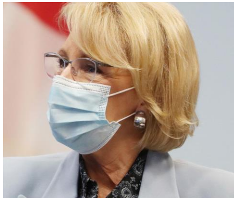
Betsy DeVos, Secretaria de Educación de EU.

Las reuniones de la junta escolar de EE. UU. son el nuevo campo de batalla por la libertad médica. Antes de la "pandemia" de Covid, los padres rara vez dudaban de las intenciones de las escuelas de gobierno hacia la salud de sus hijos. Resulta que deberían haberlo hecho. Internet está repleto de videos de padres enojados e infelices, llorando y rogando a las juntas escolares que desenmascaren a sus hijos.