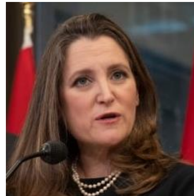
La Viceprimera Ministra, Chrystia Freeland,

Queda prohibida toda discriminación motivada por origen étnico o nacional, el género, la edad, discapacidades, condición social, condiciones de salud, la religión, las opiniones, las preferencias sexuales, el estado civil o cualquier otra que atente contra la dignidad humana y tenga por objeto anular o menoscabar los derechos y libertades de las personas. ▀